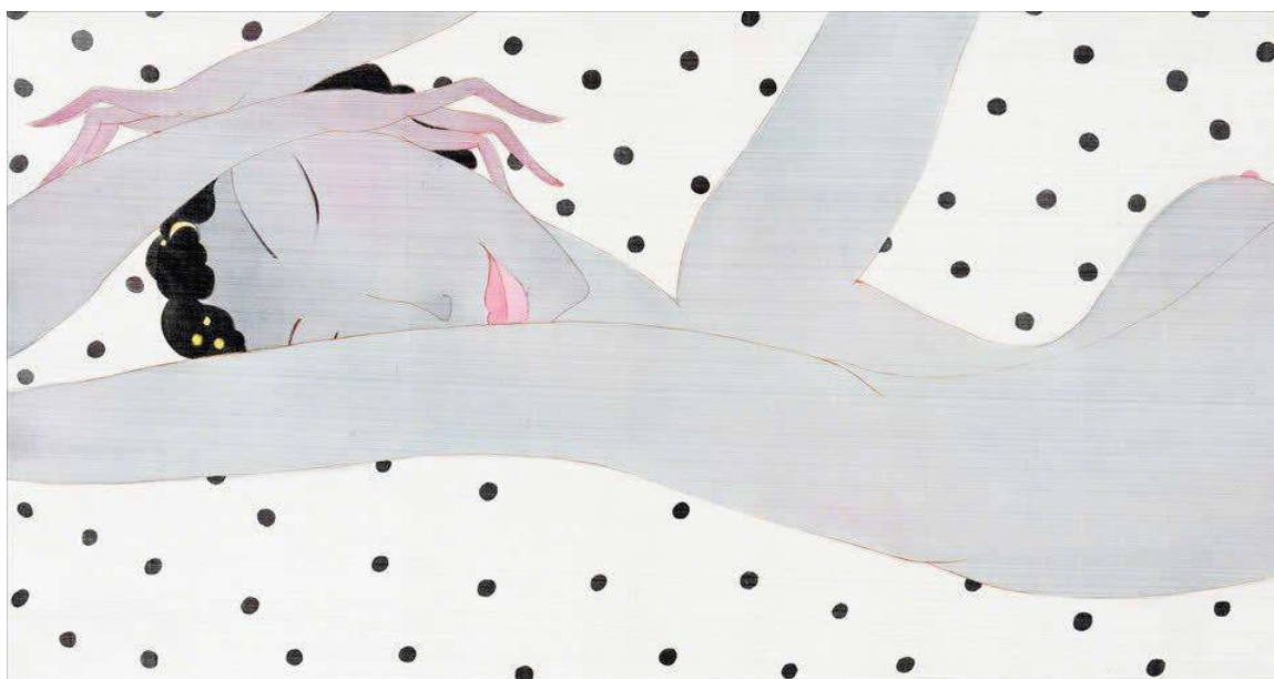
Hình 4. Bùi Tiến Tuấn (Chăm bi nắng)