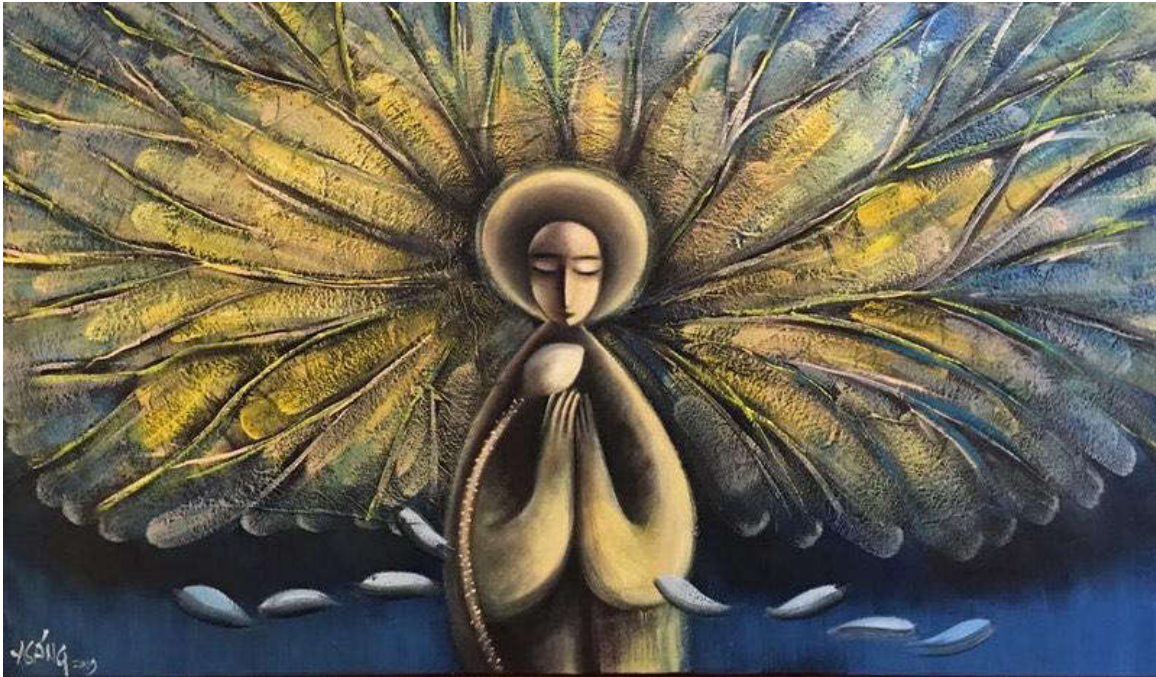
Hình 10. Hoàng A Sáng (2019)