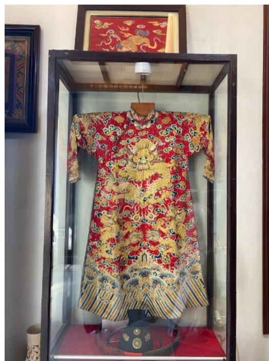
Hình 1. Áo ngũ thân tay chèn thời Nguyễn

phom dáng Áo dài truyền thống. Bằng cách cải tiến chi tiết cổ và hạ sát nách tay áo, họa sĩ Cát Tường đã thu nhỏ vùng eo, dịch chuyển phom dáng từ cấu trúc suông rộng của Áo ngũ thân sang phom dáng ôm sát, tôn vinh đường cong cơ thể.