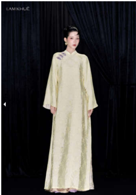
Hình 7. Áo dài thương hiệu Lam Khuê với phom dáng sưng, ống tay loe nhẹ

Về mặt truyền thông và tâm lý tiêu dùng: Hiệu ứng từ bộ phim 'Cô Ba Sài Gòn' (2017) kết hợp với tâm lý ưu tiên sự thoải mái hậu đại dịch COVID-19 đã tái định hình tư duy thẩm mỹ của giới trẻ. Hệ quả là triết lý đề cao sự tự do của thế hệ Gen Z và trào lưu Cổ phục đã biến kiểu kết cấu tuyệt đối không chiết ly từ một giải pháp cách tân trở thành một tuyên ngôn về bản sắc, giúp trang phục hòa nhập sâu vào không gian đời thường nhờ khả năng giải phóng cơ thể và thích nghi với đa dạng nhân trắc học.