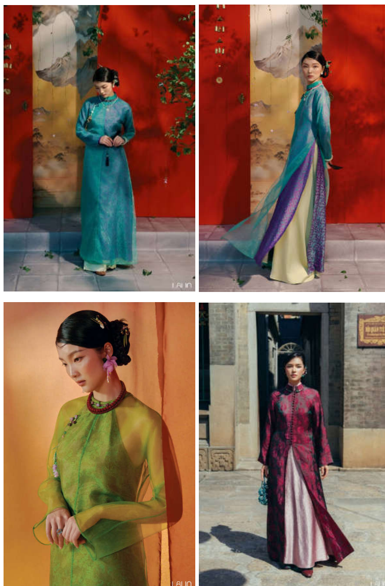
Hình 8. Áo dài thương hiệu Lalin với kết cấu nhiều tà, nhiều lớp