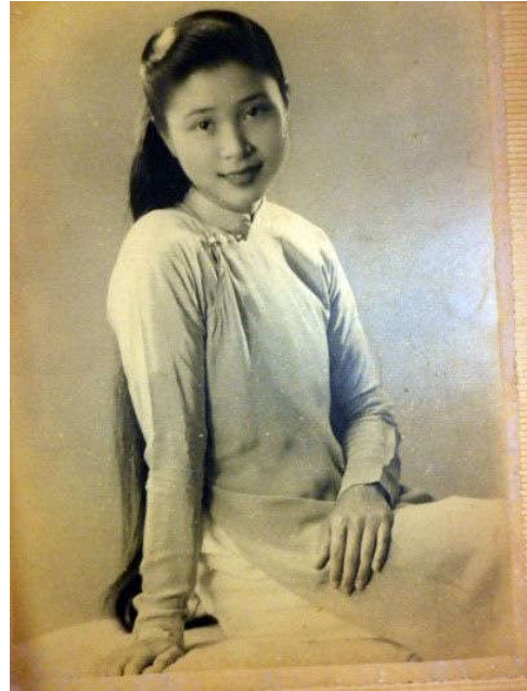
Hình 3. Áo dài Lê Phổ

Áo dài này, đồng thời cũng là đặc điểm gây ra nhiều tranh cãi thời bấy giờ.