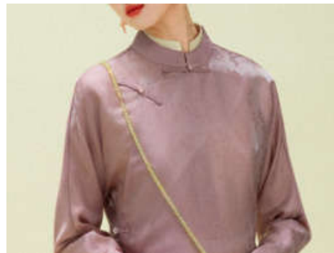
Hình 10. Kiểu khuy cài cách tân từ kiểu khuy cài áo ngũ thân.

kỹ thuật thuần túy mà đã trở thành điểm nhấn trang trí thủ công, nâng cao giá trị vi mô của sản phẩm. Sự thay đổi này minh chứng rõ nét cho một tiến trình dịch chuyển từ tư duy kỹ thuật áp đặt phom dáng kiểu phương Tây sang việc tái hồi sinh tư duy thẩm mỹ di sản phương Đông, tôn trọng chuyển động tự nhiên của cơ thể.