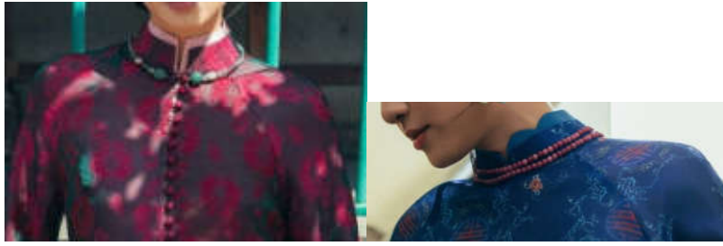
Hình 9. Một số kiểu cổ áo của Áo dài hiện nay (Nguồn: Internet)

Về kết cấu đóng mở trang phục. Sự chuyển dịch từ hệ thống khóa kéo chìm (sau lưng) sang hệ thống khuy cúc (phía trước chéo ngực hoặc sau cổ) phản ánh bước ngoặt trong tư duy kỹ thuật dệt may, gắn liền với nhu cầu giải phóng cơ thể của lối sống hiện đại.