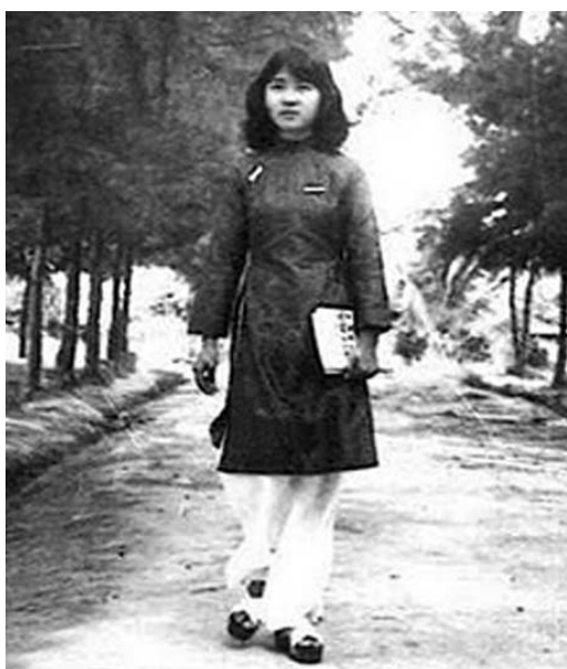
Hình 6. Áo dài Miniraglan

Năm 1970. Chiếc Áo dài truyền thống của Việt Nam ra đời, Áo ôm khít cơ thể người mặc hơn, cổ cao và quần ống rộng dài. Cổ áo cao từ 4 đến 5 cm, tôn lên vẻ đẹp cổ cao ba ngấn trắng ngà của người phụ nữ Việt. Áo có tà trước, tà sau,