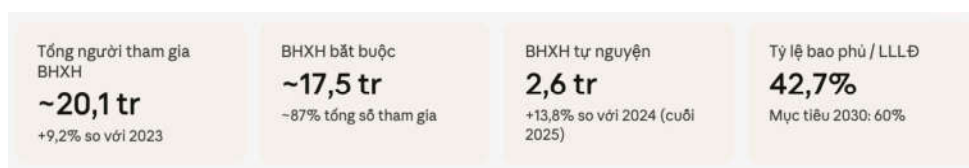
Bảng 2. Số lượng tham gia BHXH Việt Nam 2023 - 2025

ngân sách nhà nước đảm bảo); BHXH bắt buộc và BHXH tự nguyện (tầng 2); và bảo hiểm hưu trí bổ sung (tầng 3), hướng tới mục tiêu bao phủ toàn dân.