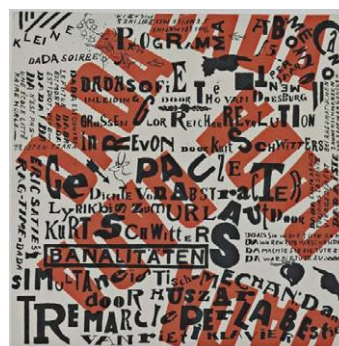
H1. Kurt Schwitters và Theo Van Doesburg, Kleine dada soiree (1922-23)